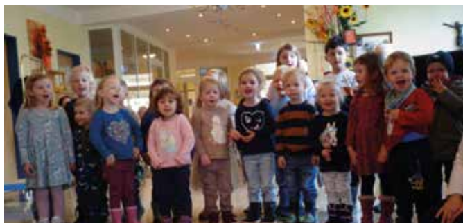
Uns jedenfalls hat es Spaß gemacht und wir hoffen auch den Senioren