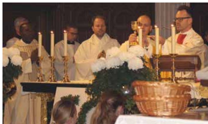
Bei der Gabenbereitung