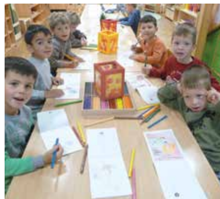
Laternenbasteln läutet eine besondere Zeit ein. Da geht unser Herz richtig auf.