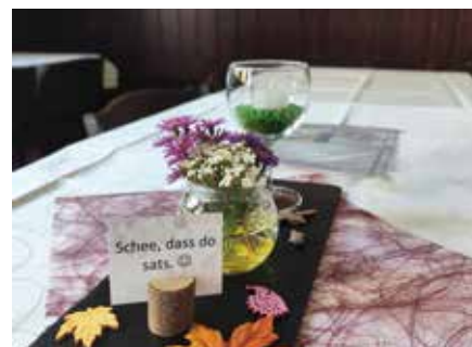
liebevolle, herbstliche Dekoration begrüßte die Gäste