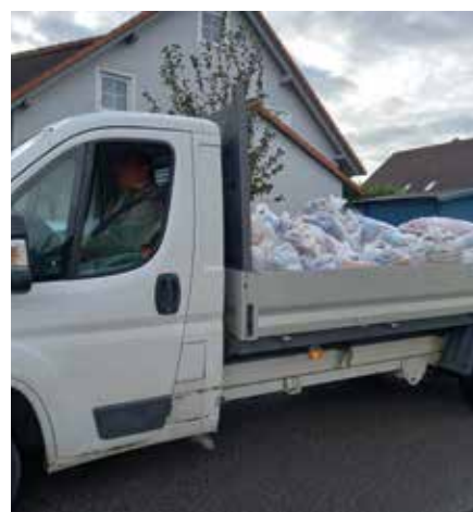
Voll gepackt gehts nach Biburg zum Abladen