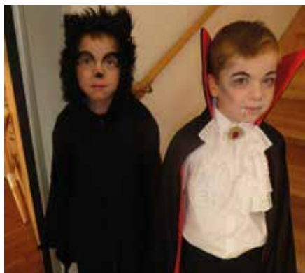
Fledermäuse und Graf Dracula sind auch dabei