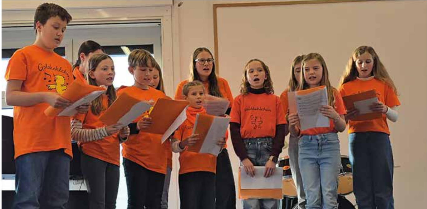
Die Goldkehlchen sangen amüsante und beschwingte Lieder.