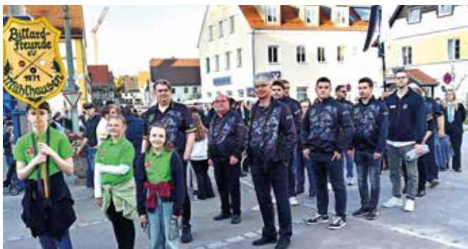
Die Teilnehmer der Billardfreunde am Michaelmarkt Einzug.

erstmalig am Einzug mit einer großen Gruppe. Anschließend ging es ins Festzelt zu Freibier und Brotzeit.