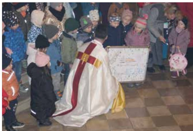
Gratulation vom Kindergarten St. Michael Train