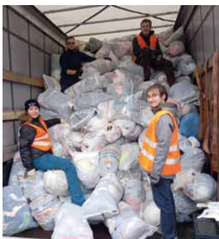
Einmal alles in den LKW schichten