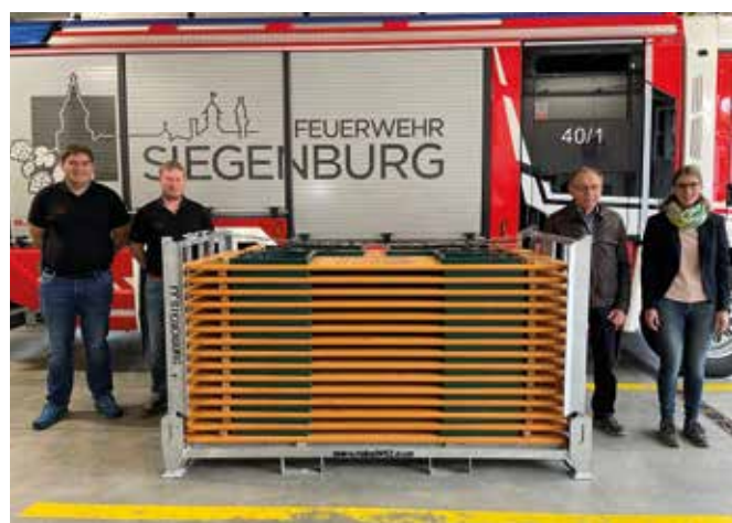
Die Siegenburger Freiwillige Feuerwehr freut sich über neue Biertischgarnituren

Im Rahmen des Regionalbudgets 2025 der ILE ABENS erhielt die Freiwillige Feuerwehr Siegenburg e.V. einen finanziellen Zuschuss für die Anschaffung von 15 Sitzgarnituren für Veranstaltungen der Kinder- und Jugendfeuerwehren, sowie für gesellschaftliche und kameradschaftliche Veranstaltungen. Gefördert wird das Regionalbudget mit Mitteln des bayerischen Staatsministerium für Ernährung, Landwirtschaft, Forsten und Tourismus mit Unterstützung durch das Amt für ländliche Entwicklung Niederbayern. Das umgesetzte Kleinprojekt der Siegenburger Feuerwehr wurde mit 80 % der förderfähigen Ausgaben und eine Fördersumme von 3.048,00€ bezuschusst. Aus Mitteln des Feuerwehrvereines wurde zusätzlich