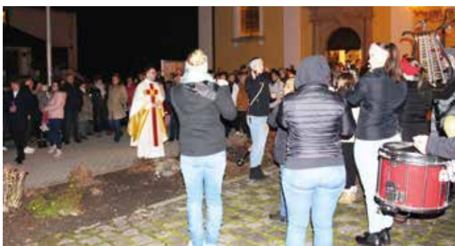
Der HVT-Spielmannzug auf der rechten Seite