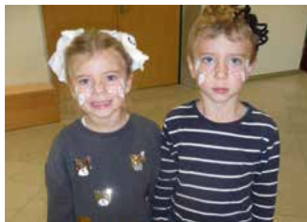
Schaurig schöner Besuch kommt im Herbst in der Kita