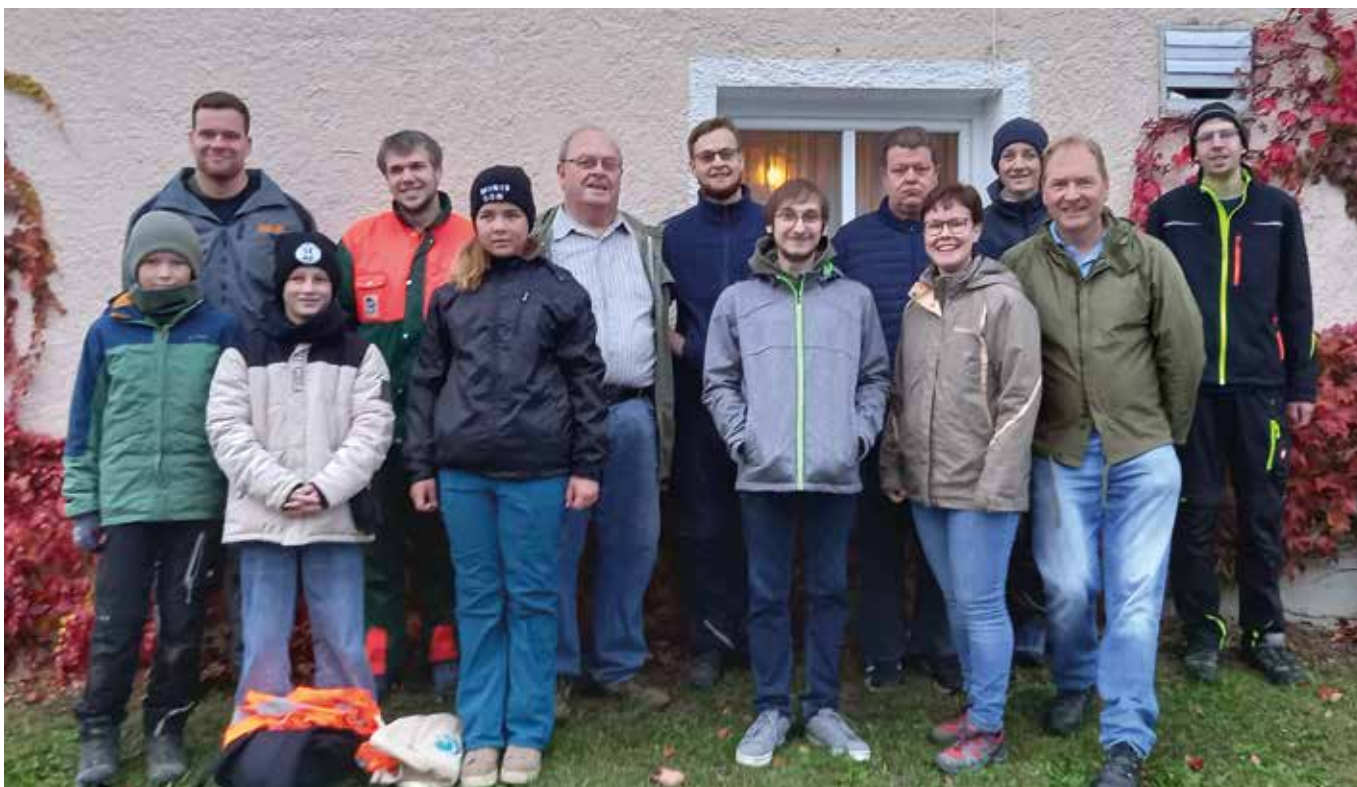
Die fleißigen Helfer