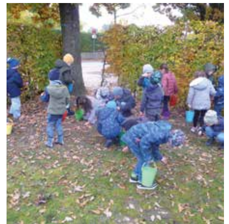
Wie kleine Wichtel sausen wir durch Siegenburg