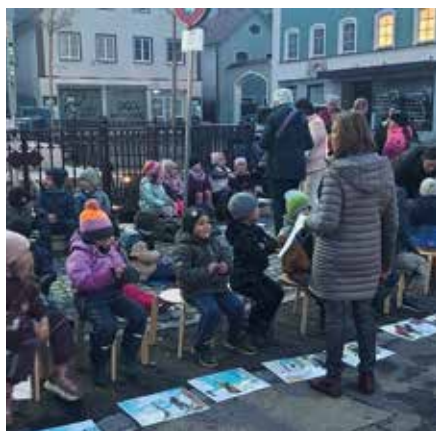
Und wieder ist St. Martinstag