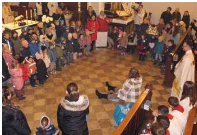
Gratulation vom Kindergarten St. Nikolaus Siegenburg