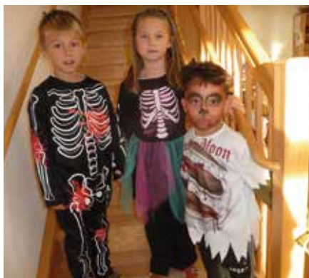
Keine Sorge, es gab Süßigkeiten, um die gefährlichen Monster in Schach zu halten