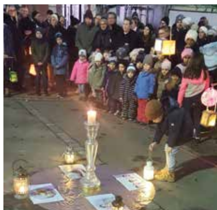
Wir tragen das Martinslicht auch zu den Kranken - Armen - und Kindern