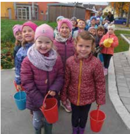
Bepackt mit kleinen Eimern machen wir uns auf zu unserem Herbstspaziergang