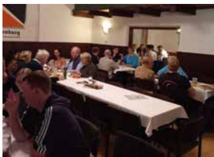
Die Besucher im gemütlichen Kolpingheim

pingsfamilie bedankt sich bei den fleißigen Helfern und bei der Feuerwehr Siegenburg für die Leihgabe diverser Utensilien. Der größte Dank geht an alle Besucher, die unser Herbstfest wieder zu einem Erfolg werden ließen. Wir freuen und sehr auf das nächste Jahr und hoffen darauf, dass wieder viele Leute in unser Kolpingheim finden.