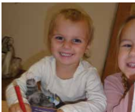
Nach so viel frischer Luft ist es in unserer warmen Kita wieder besonders schön