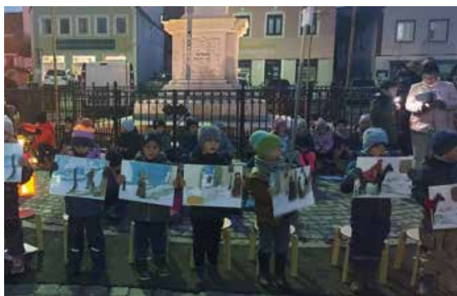
Die Vorschulkinder tragen die Martinslegende vor