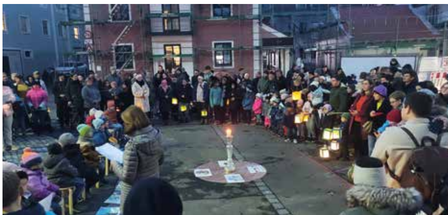
Zu Ehren des Hl. Martin feiern wir eine Andacht an der Mariensäule