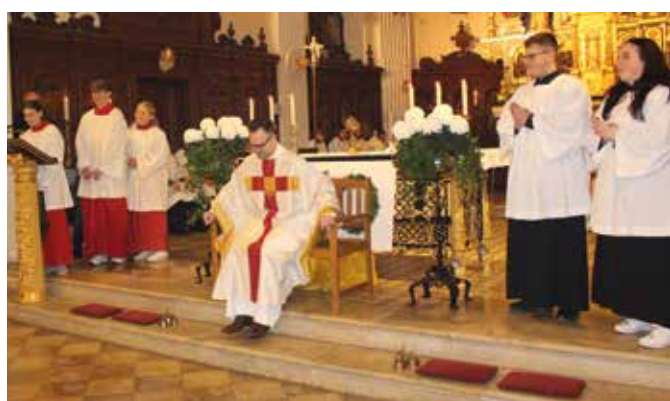
Eine Ruhebänk von den Ministranten