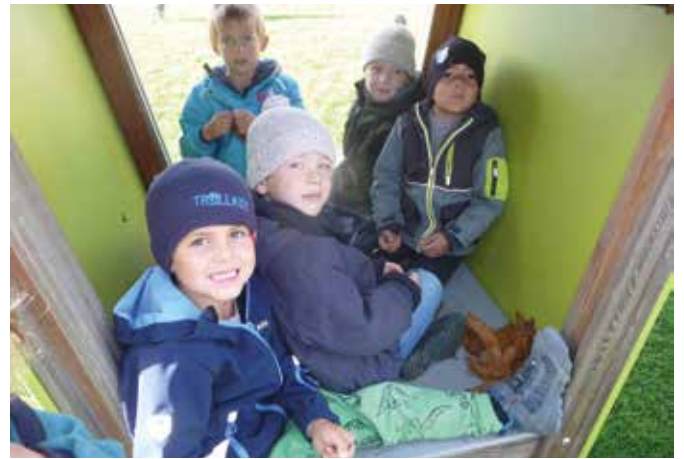
Hin und wieder brauchen wir eine Pause vom Herbstwetter