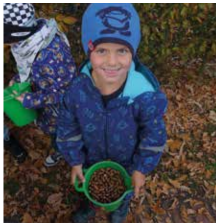
Auf unserem Weg finden wir unzählige kleine Geschenke der Natur