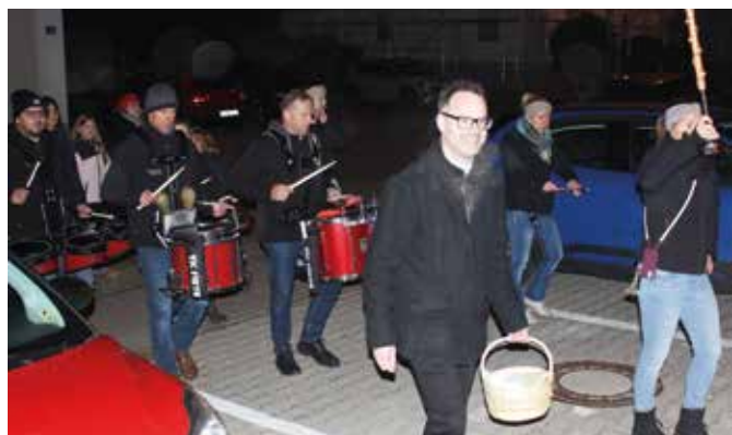
Zug zum Pfarrheim