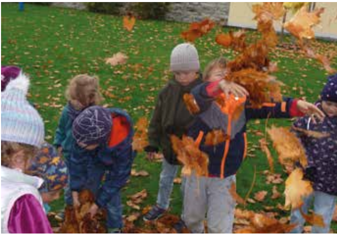
Hui, wir lassen die Blätter wirbeln wie ein stürmischer Herbstwind

Kein anderer Monat ist so trüb, neblig, kalt und dunkel aber trotzdem lieben wir Kinder den November. Wir unternahmen Spaziergänge durch raschelndes Laub, spielten im Garten und hörten drinnen, im Warmen, viele schöne Geschichten. Um auch anderen eine Freude zu machen, besuchten wir das Seniorenheim und sangen dort mit den Bewohnerinnen und Bewohnern. Natürlich bereiteten wir uns auch auf Sankt Martin vor, eines unserer liebsten Feste im Jahr. Mit viel Freude bastelten wir Laternen, sangen Martinslieder und fieberten dem großen Abend entgegen. Unser neu gewählter Elternbeirat hatte den Garten und das Essen wunderbar vorbereitet. Und so zogen wir laut singend vom Marktplatz in unsere Kita ein und verbrachten dort einen wunderschönen Abend voller Lichter und fröhlicher Stimmung. Ein herzliches Dankeschön an alle, die diesen besonderen Tag möglich gemacht haben!