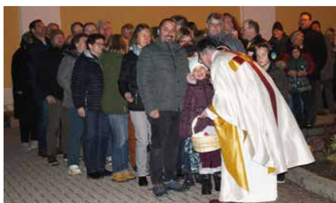
Viele gratulierten persönlich