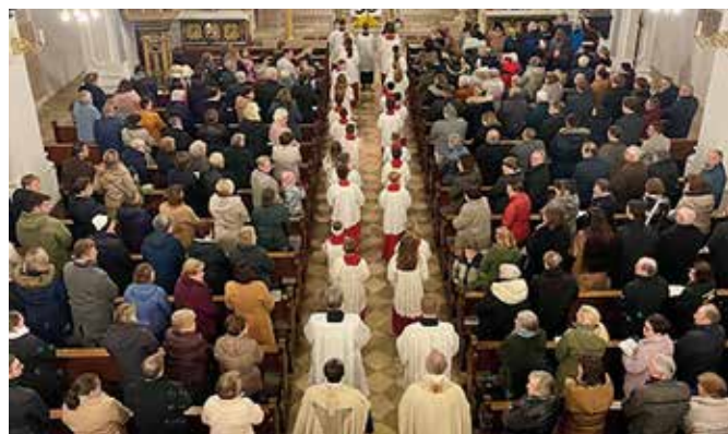
Einzug in die Kirche